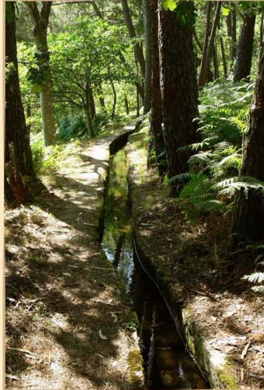
Levada da Ponte Silveira

Percurso pelas levadas de rega do Coentral, passando pela Ribeira das Quelhas, Ribeira do Coentral e Ribeira do Cavalete