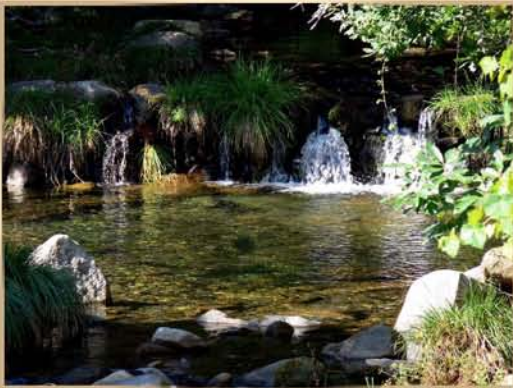
Ribeira de Pera