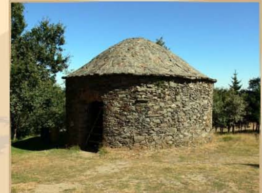
Poço da Neve