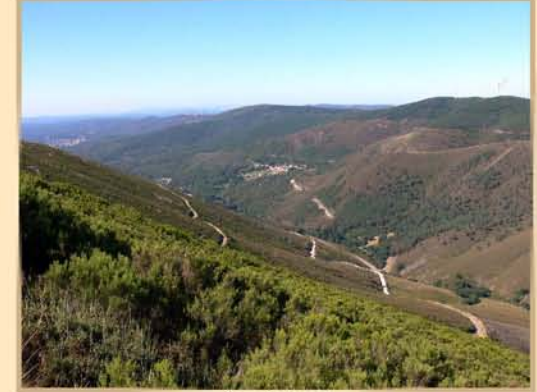
Serra da Lousã

Percurso histórico, usado antigamente pelos Neveiros, quando iam do Coentral para o S. António da Neve, recolher a neve para os poços.